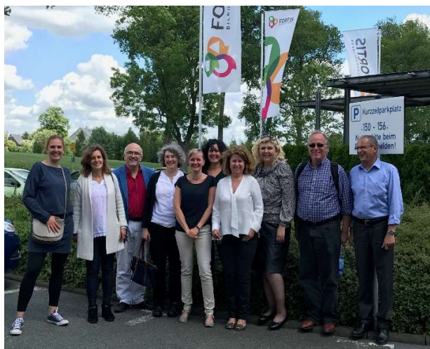
Socios del proyecto SAFERPLAY en las instalaciones del instituto FÜR LEBENSLANGES LERNEN DER FORTIS-FAKULTAS GMBH.

El pasado mes de junio tuvo lugar la quinta reunión de seguimiento del proyecto SAFERPLAY en la sede del INSTITUT FÜR LEBENSLANGES LERNEN DER FORTIS-FAKULTAS GMBH (ILL) en Chemnitz (Alemania), uno de los socios del proyecto.