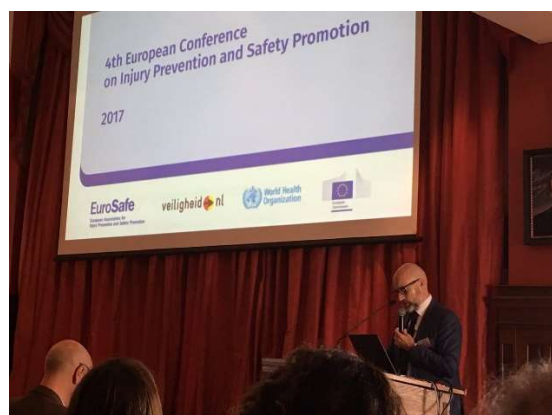
Presentación del proyecto SAFERPLAY dentro de la cuarta Conferencia Europea sobre Prevención de Lesiones y Promoción de la Seguridad.