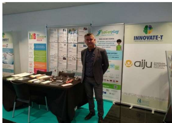
Stand del 1º Foro de innovación para empresas de la provincia de Alicante con el roll-up del proyecto SAFERPLAY entre otros.