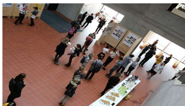
Poster SAFERPLAY presentado en la Conferencia de arquitectura para niños en Praga.